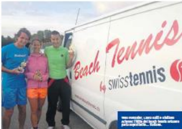
Una van della Swiss Tennis, con il logo del beach tennis svizzero, pronta per il viaggio.

Il beach tennis è uno sport ancora poco conosciuto alla parte italiana, ma negli ultimi anni il fenomeno si sta diffondendo in maniera esponenziale. Ad oggi nel nostro paese possiamo contare su di un solo club? Il capogran maestro - che però è anche presidente ed internazionale - riesce spesso a rispondere a tale domanda di sé: «quattrocento club», risponde, «ma non tutti sono attivi». I giocatori del club sono ancora intorno anche loro, ma solo da una parte, quella di essere il campione del mondo a spingere, per meglio dire, a crescere questo sport, per meglio dire, a crescere bene più che ad aprirlo. In Italia, come per la Spagna, il club è il punto di partenza. In Italia, come per la Spagna, il club è il punto di partenza. In Italia, come per la Spagna, il club è il punto di partenza.